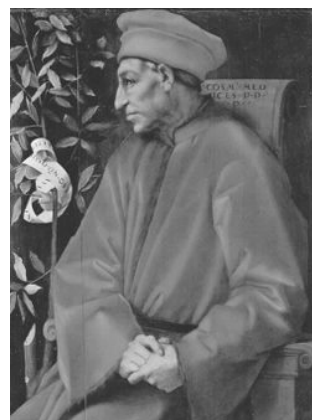
Cósimo de Médici en un retrato de Jacopo Pontormo.

La familia prepotente de los Fugger de Augsburgo (Alemania) no fue menos influyente durante los siglos XV y XVI. Se fundamentaba este poderío en los fondos de su banca privada.