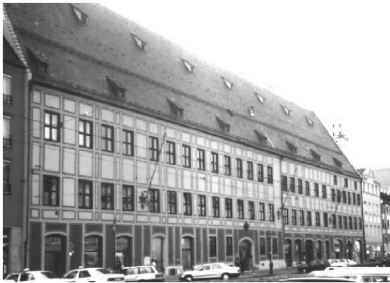
Stadtpalast de los Fugger en Augsburg, Alemania.

Varios de sus miembros, como Alberto, llegaron a ser prestamistas de reyes o de quienes aspiraban a serlo, y a su vez fueron un factor decisivo en la elección de monarcas y emperadores. Con el dinero prestado al aspirante, éste podía comprar los votos de los príncipes electores y así ser elegidos entre los varios aspirantes. De esta manera Carlos I pudo llegar a ser elegido emperador del Sacro Imperio Romano Germánico. Posteriormente, los banqueros continuaban realizando otros negocios, sobre todo para financiar las guerras que los mismos reyes mantenían en Europa.