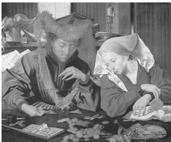
El cambista y su mujer (1539), por el pintor holandés Jacob van Ruysdael.

3. Los viajes de descubrimiento, llevados a cabo por españoles y portugueses, de los que hemos tratado ampliamente en la Unidad XVI, contribuyeron poderosamente al incremento del intercambio del comercio y, por tanto, a la expansión y el crecimiento de dicha actividad. El origen de los mismos había tenido, como uno de sus mayores incentivos, el deseo de obtener nuevos productos o de conseguirlos más fácilmente o a un mejor precio. Descubierta el Nuevo Mundo, así como las rutas hacia el Oriente y Asia, bordeando las costas de África, de la India y de China, y establecidas las debidas colonias, se vino a intensificar el intercambio comercial, tanto entre dichos lugares con Europa, como entre este continente y los más remotos países del orbe. El comercio se abrió hacia nuevos horizontes: ya no sólo era local y nacional, sino internacional.