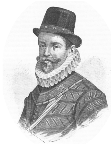
John Hawkins (arriba) y Francis Drake (abajo), fueron personajes fundamentales en la historia de Inglaterra en el siglo XVI. Grandes marinos, piratas y los primeros traficantes de esclavos, también ayudaron a dar la victoria a la flota de su país sobre la Armada Invencible española en 1588.

3. El aumento de capital produjo al cabo del tiempo la inflación, el encarecimiento desmedido de los productos y bienes y el subsiguiente empobrecimiento de las clases menos privilegiadas. Esto trajo como consecuencia la debilidad y el desequilibrio de los gobiernos, fruto además de las fluctuaciones de las reservas de metales preciosos, pues muchas de las minas no tardaron en agotarse. La piratería, patrocinada por gobiernos, como el de Inglaterra y el de Holanda, fue también un importante factor destabilizador. Los barcos piratas o bien invadían los puertos y asentamientos del Nuevo Mundo, como Panamá, San Juan de Puerto Rico, Cartagena de Indias, etc., y hasta en sus desmanes se apoderaban de algunas islas del Caribe, o bien atacaban los galeones, cargados de metales preciosos y de bienes, cuando se dirigían desde América por lo común a España. Dichos países protectores de piratas, a quienes llegaban incluso a condecorar y premiar con bienes y prebendas, se dedicaron durante lustros a este negocio lucrativo y a todas luces ilegal e injusto, por no decir criminal, por las muertes con que iban acompañados. Debido a ello, muchas firmas y bancos quebraron, así como no pocos ricos cayeron en la ruina y en bancarrota. Pero los más perjudicados fueron los estados y gobiernos, además de los